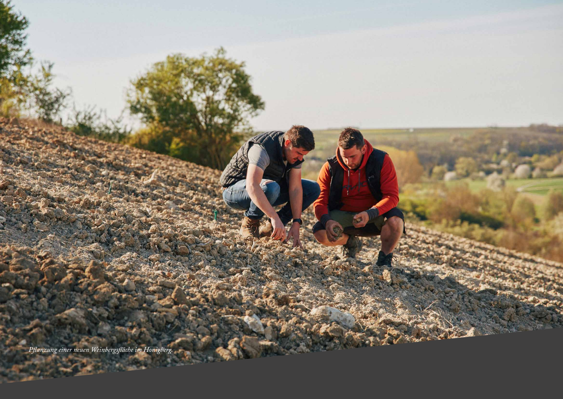
Pflanzung einer neuen Weinbergsfläche im Honigberg.