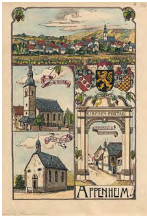
Appenheim. - Mehransichtenblatt. - "Appenheim".

Historische Ortsansicht. Kolorierter Holzstich, um 1910. 18,0 x 11,6 cm (Darstellung) / 20,3 x 13,8 cm (Blatt).